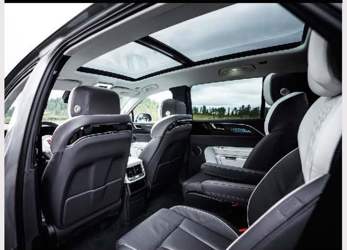
6-Sitzer Exclusive und Exclusive Long Range Version