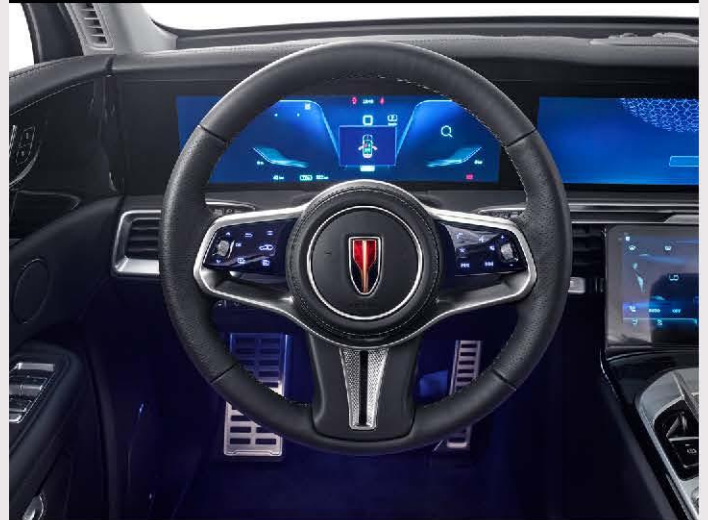
Intelligentes, sensorgesteuertes Lenkrad