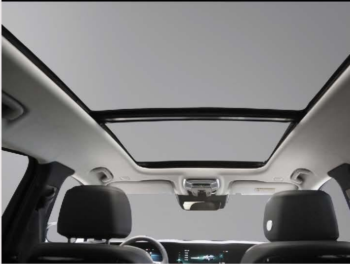
Panorama-Glasdach bei allen Versionen