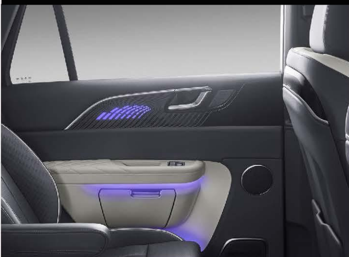
Detaildesign für die zweite Sitzreihe